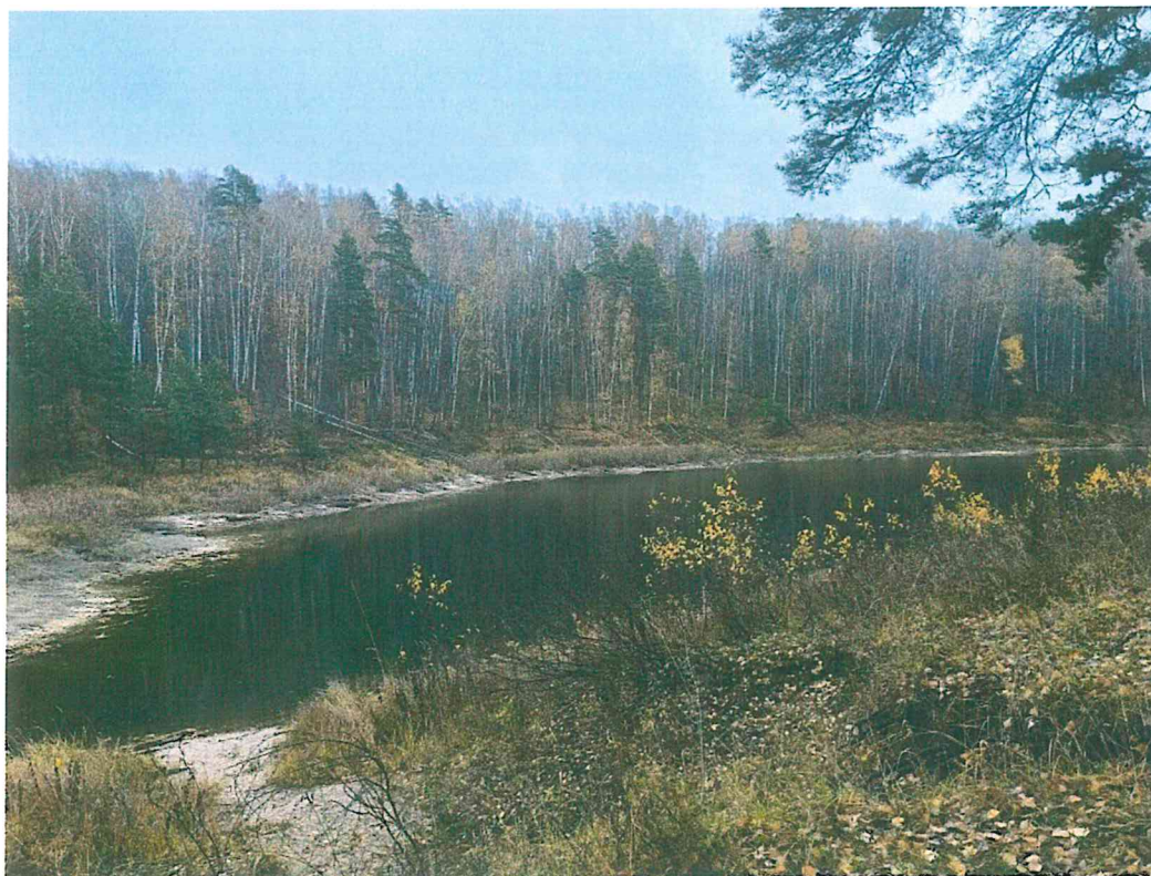
1. Озеро Мушан-Ер.