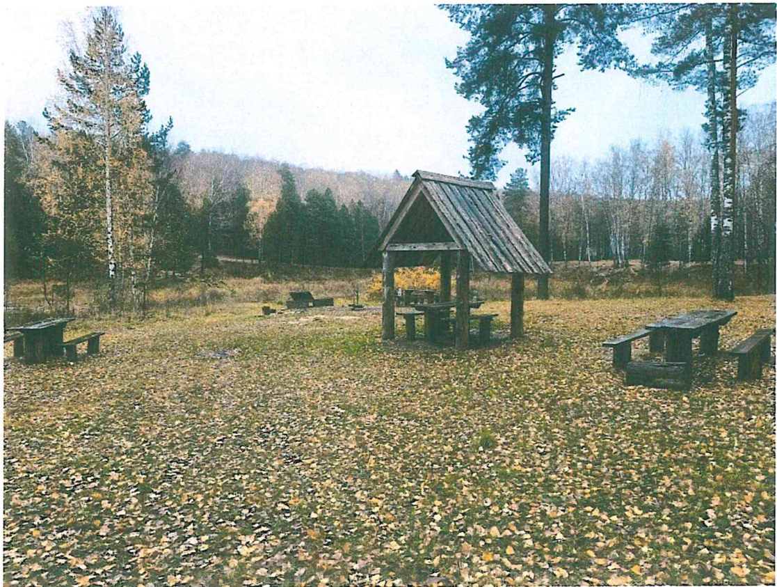
6. Беседки и зоны отдыха на берегу оз. Мушан-Ер.