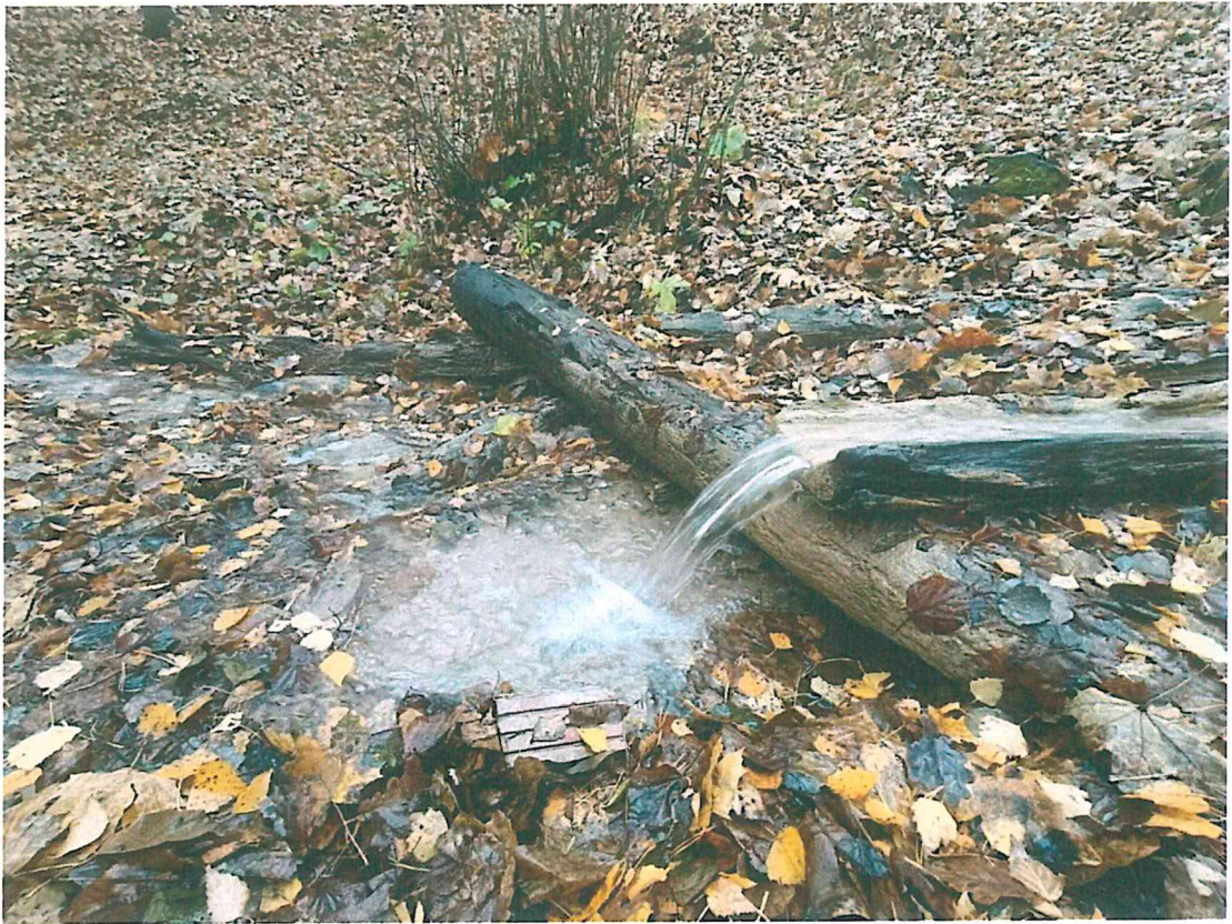
3. Кальциевый источник на оз. Мушан-Ер.