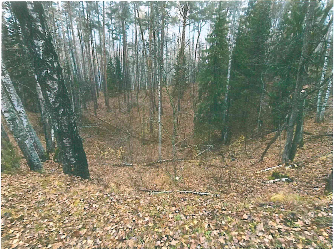
5. Карстовые провалы по маршруту.