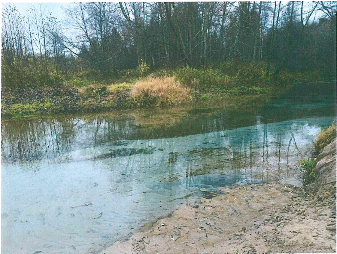
4. Устье сточника Зеленый ключ, слияние с р. Илеть.